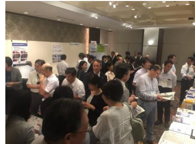
平成29年7月22日 第1回セミナー（東京都大田区）展示会場の様子